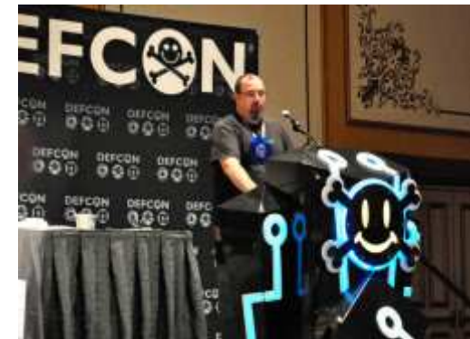
ヒューレット・パッカートのスミス氏はソフトの脆弱性を指摘した (米ラスベガス)