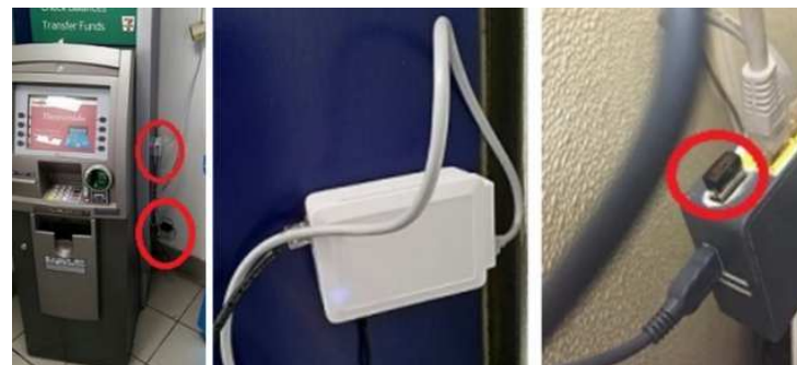
ネットワークケーブルに取り付けられたスキミング装置